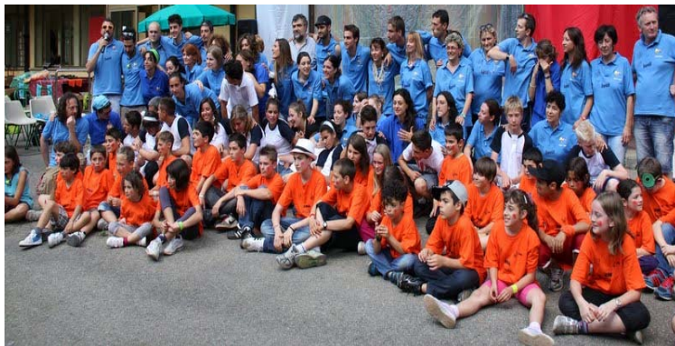
FIGURE PROFESSIONALI COINVOLTE:

Medici specialisti e specializzandi in pediatria, con specifica preparazione in ambito diabetologico, medico diabetologo, dietista, psicologa, infermieri professionali ed in formazione del Centro di Endocrinologia dell'Infanzia si occuperanno della formazione dei ragazzi all'autogestione del diabete. Operatori